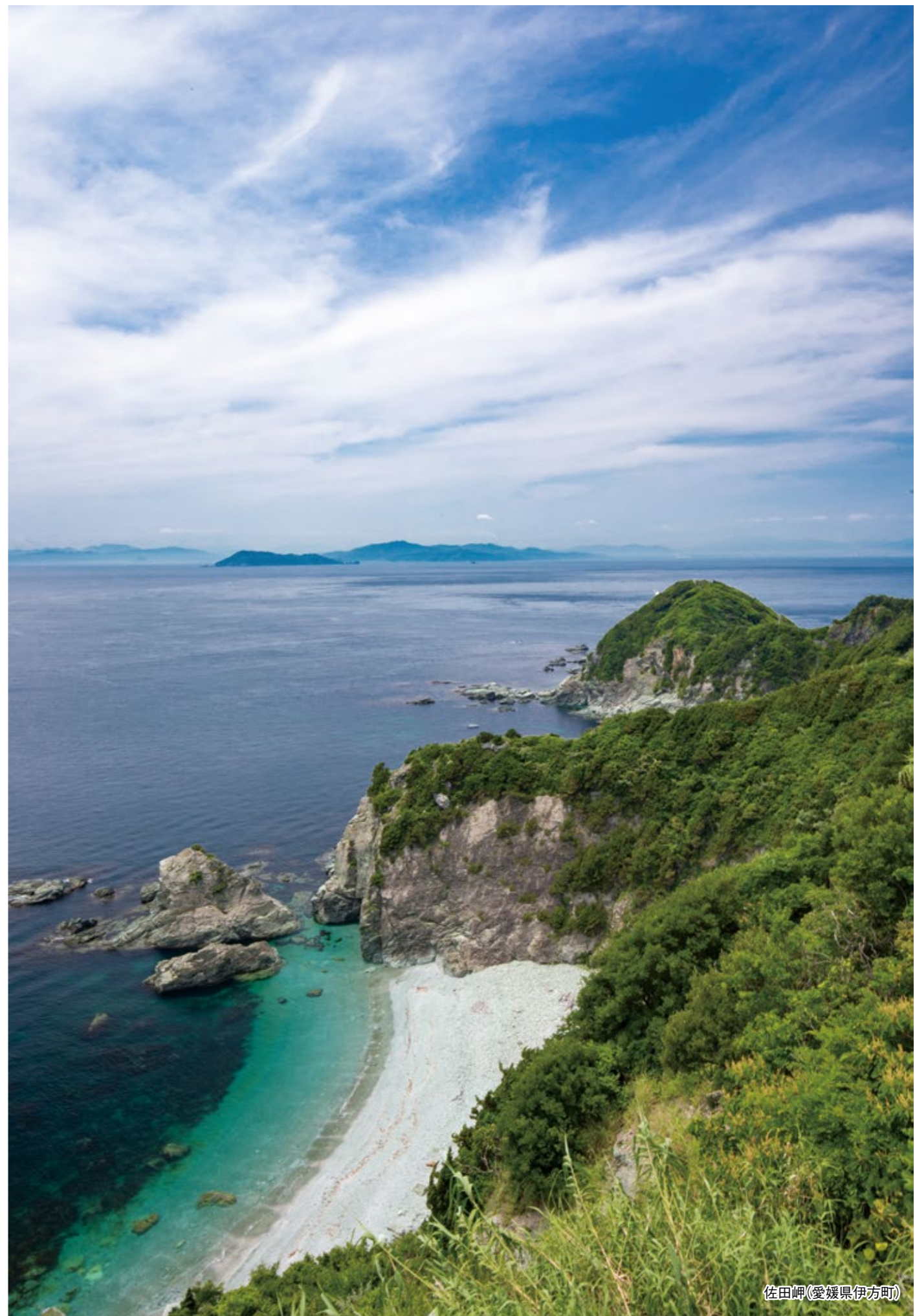
佐田岬(愛媛県伊方町)

●数量限定品、および天候、メーカーの都合等で第1希望の優待品をお届けできなくなった場合は、第2、第3希望の優待品に振り替えさせていただきます。万一、第3希望の優待品もご希望に沿えない場合は、事務局よりご連絡いたします。●クール宅急便に限り、一部離島へはお届けできません。●アレルギー物質を含む特定原材料8品目を表記しております。●賞味期限および消費期限は、出荷日より残り日数の目安を表記しております。●20歳未満の方はお酒のお申し込みはできません。●状況によりお届けが遅れる場合があります。●天候等によりお届けする品物に影響が出る可能性があります。