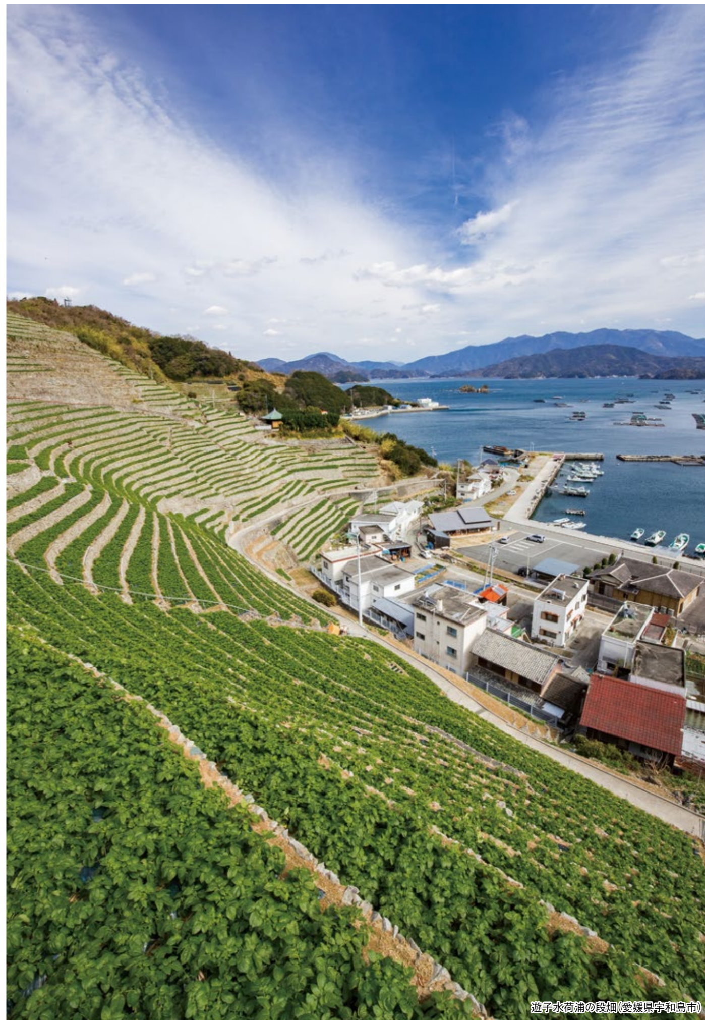
遊子水荷浦の段畑(愛媛県宇和島市)

●数量限定品、および天候、メーカーの都合等で第1希望の優待品をお届けできなくなった場合は、第2、第3希望の優待品に振り替えさせていただきます。万一、第3希望の優待品もご希望に沿えない場合は、事務局よりご連絡いたします。●クール宅急便に限り、一部離島へはお届けできません。●アレルギー物質を含む特定原材料8品目を表記しております。●賞味期限および消費期限は、出荷日より残り日数の目安を表記しております。●20歳未満の方はお酒のお申し込みはできません。●状況によりお届けが遅れる場合があります。●天候等によりお届けする品物に影響が出る可能性があります。