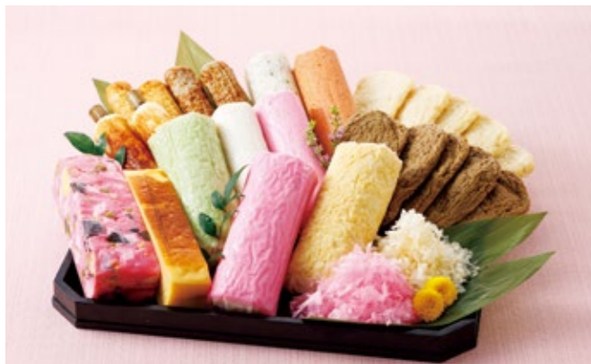
※賞味期限の短い優待品です。お申し込みの際にはご留意願います。写真はイメージです。